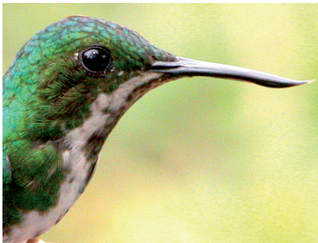
FIGURA 1: Fêmea do Beija-flor-de-bico-virado Avocettula recurvirostris capturado em vegetação de Cerrado strictu sensu no Município de Palmas, Tocantins (Foto: Renato Torres Pinheiro).

FIGURE 1: Female Fiery-tailed Aowlbill Avocettula recurvirostris captured in Cerrado strictu sensu vegetation at Palmas Municipality, Tocantins (Foto: Renato Torres Pinheiro).