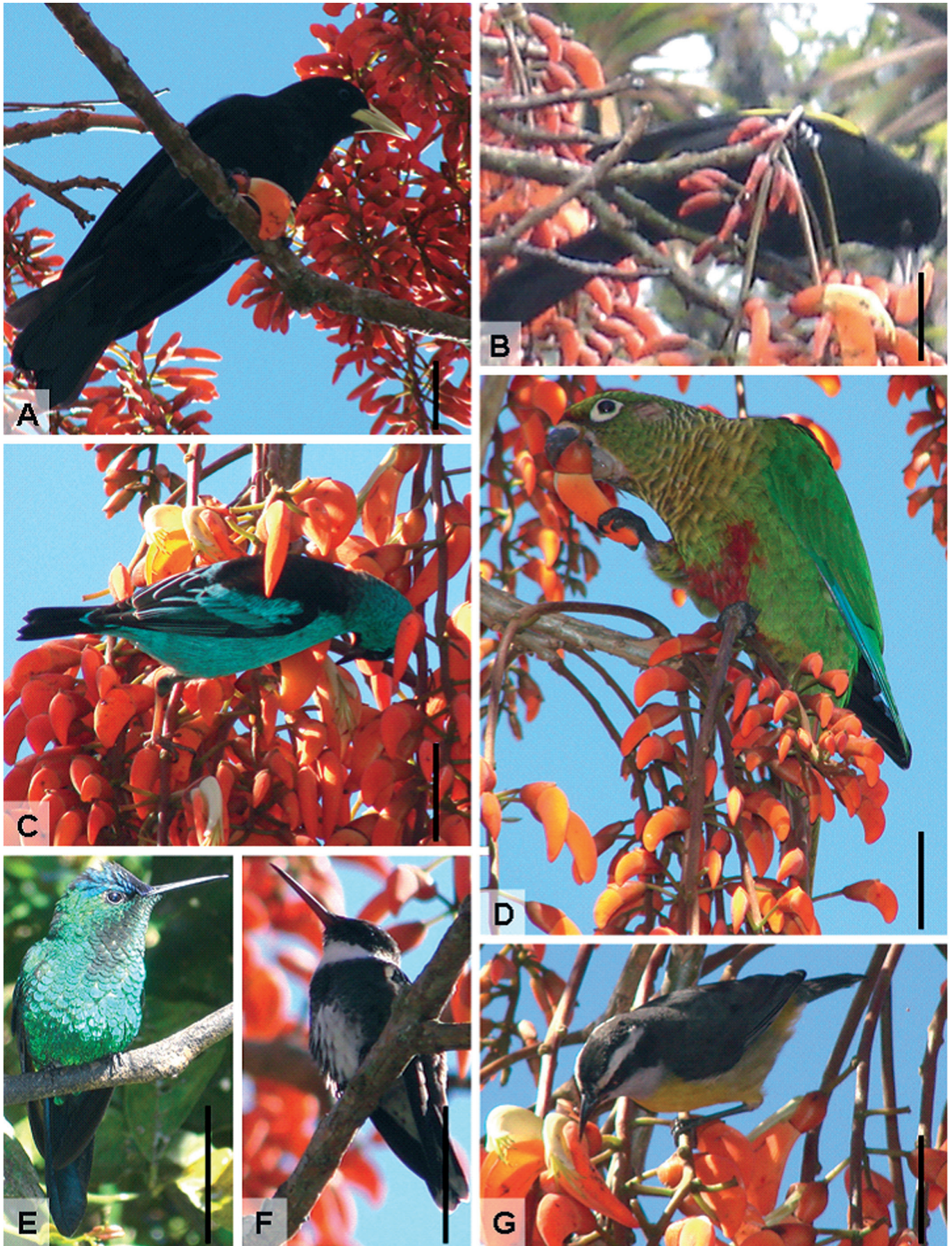
FIGURA 2: Visitantes florais de Erythrina falcata no Parque Nacional do Itatiaia. (A) Cacicus haemorrhous ; (B) Cacicus chrysopterus ; (C) Dacnis cayana ; (D) Pyrrhura frontalis ; (E) Thalurania glaucopis ; (F) Leucochloris albicollis e (G) Coereba flaveola . Escala (barras) = 4 cm.