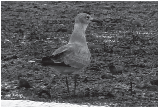
FIGURA 8: Leucophaeus atricilla ; Represa de Guarapiranga, São Paulo, Brasil, 11 de novembro de 2008.

FIGURE 7: Laughing Gull Leucophaeus atricilla ; Cabo Frio, Rio de Janeiro, Brazil, 14 July 2007.