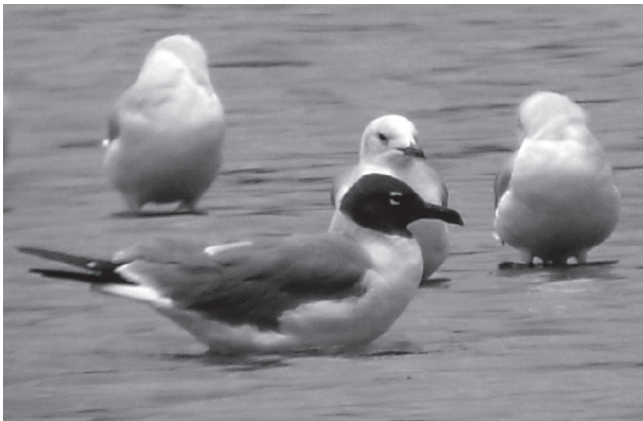
FIGURA 7: Leucophaeus atricilla ; Cabo Frio, Rio de Janeiro, Brasil, 14 de julho de 2007.

Em 14 de Julho de 2007, L. M. L., S. S. e J. F. M. registraram um único adulto de L. atricilla com plumagem reprodutiva (Figura 7) numa salina desativada (22°52'14"S, 42°02'01"W), nas proximidades do Canal de Itajurú, município de Cabo Frio, Rio de Janeiro. Na ocasião, a ave estava descansando junto a um bando com quase uma centena de Chroicocephalus cirrocephalus e trinta Larus dominicanus . Pouco mais de dois anos após esse registro, em 15 de fevereiro de 2009, os mesmos autores voltaram a observar a espécie no mesmo local, mas dessa vez um indivíduo com plumagem de descanso