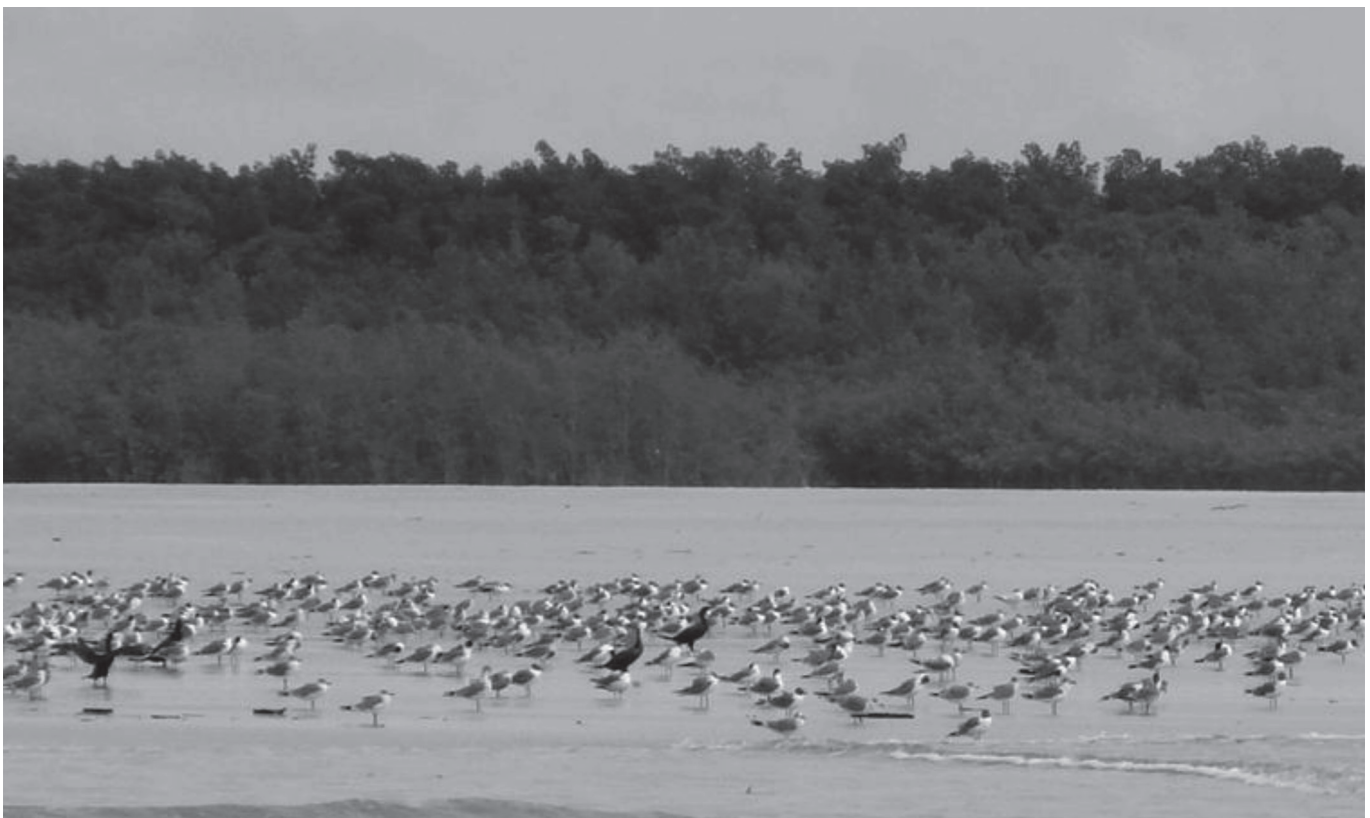
FIGURA 1: Extensos manguezais na costa do Pará, norte do Brasil. Note o bando formado por Leucophaeus atricilla e Phalacrocorax brasilianus . FIGURE 1: Extensive mangroves on the coast of Pará, northern Brazil. Note the large flock of Laughing Gulls Leucophaeus atricilla and Neotropic Cormorants Phalacrocorax brasilianus .

Os registros de L. atricilla fora da costa norte brasileira foram obtidos de forma oportunística durante