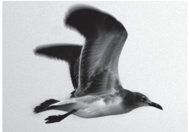
FIGURA 5: Leucophaeus atricilla ; porto do Pecém, Ceará, Brasil, 07 de outubro de 2006.

FIGURE 4: Laughing Gull Leucophaeus atricilla ; Parque Nacional do Jaú, Amazonas, Brazil, 02 October 2004.