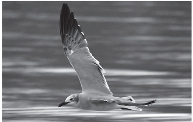
FIGURA 6: Leucophaeus atricilla ; São Francisco do Conde, Bahia, Brasil, 22 de outubro de 2008.

FIGURE 5: Laughing Gull Leucophaeus atricilla ; Pecém Harbor, Ceará, Brazil, 07 October 2006.