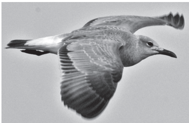
FIGURA 4: Leucophaeus atricilla ; Parque Nacional do Jaú, Amazonas, Brasil, 02 de outubro de 2004.

Em 2 de outubro de 2004, Bret Whitney observou um indivíduo com plumagem de primeiro inverno na margem