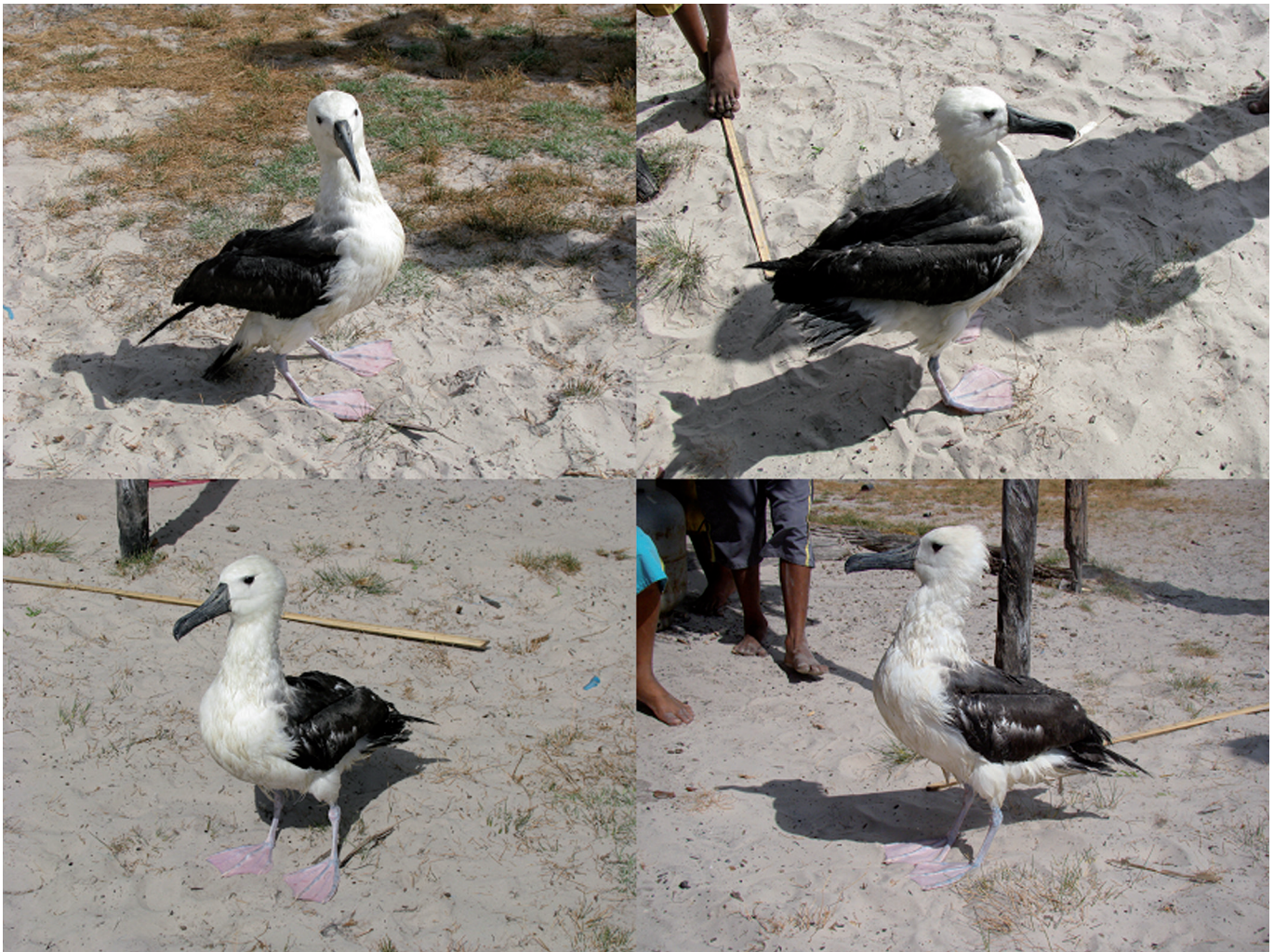
FIGURA 2: Albatroz-de-nariz-amarelo Thalassarche chlororhynchos , Ilha de Iguará, Maranhão, Brasil, 29 de outubro de 2008. FIGURE 2: Atlantic Yellow-nosed Albatross Thalassarche chlororhynchos , Ilha de Iguará, Maranhão, Brazil, 29 October 2008.

comunitários de Iguará pela acolhida e receptividade dispensada a nossa equipe.