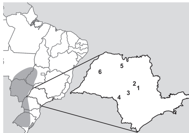
FIGURA 2: Mapa com a distribuição de Heliomaster furcifer no Brasil segundo Perlo (2009), com a indicação dos pontos de ocorrência no Estado de São Paulo. Municípios: 1. Brotas; 2. Dourado; 3. Lençóis Paulista; 4. Bernardino de Campos; 5. S. J. do Rio Preto; 6. Valparaíso.

Grantsau, R. (1988). Os Beija-flores do Brasil . Rio de Janeiro: Expressão e Cultura.