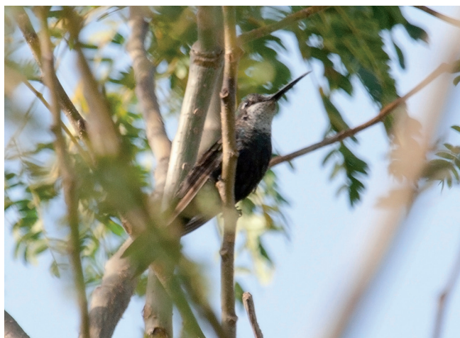
FIGURA 1: Registro fotográfico de Heliomaster furcifer . Brotas, SP.

FIGURE 1: Photographic record of Heliomaster furcifer . Brotas, SP.